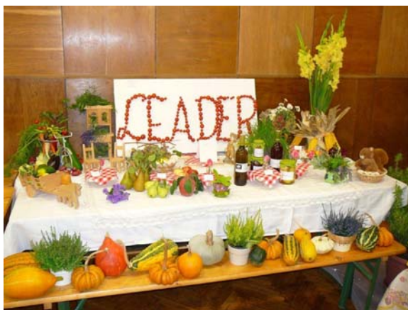
SZMSLE standja a kimlei kiállításon

Terménykiállítás: 4. alkalommal készítették el terménykiállításukat a kimlei Kertbarát Kör tagjai, a helyi iskolások, óvodások, valamint a kertészkedő magánszemélyek. A szebbnél szebb virágokkal, zöldségekkel, gyümölcsökkel, ötletes feldolgozásokkal zsúfolásig megtelt a felújított Művelődési Ház színházterme. Jó látni, ahogy egyre többen vesznek részt a közösség munkájában, nem csupán nézelődőként, hanem kiállítóként is jelen vannak, egymással megosztják praktikáikat és tapasztalataikat. Idén a Szigetköz - Mosoni-sík LEADER Egyesület is kiállítóként volt jelen, "Leader Piac" névre hallgató asztalán a zöldségek, gyümölcsök, virágok mellett a befőttek, szörpök és gyógynövények is közszemlére kerültek.