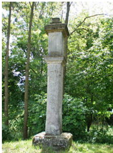
A francia oszlop („kőkíp”)