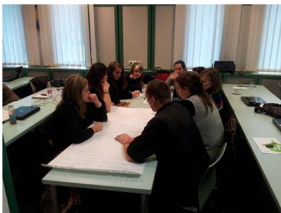
A résztvevők egy csoportja fejlesztési irányok megfogalmazása közben