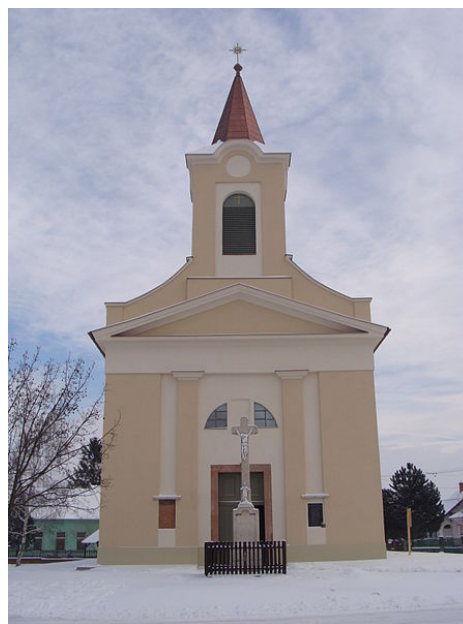
A dunaszentpáli templom

Településeink - Dunaszentpál: Horvátul két neve létezik a falunak. A horvátkimleiek Sepal-nak, a bezenyeiek Sempal-nak nevezik. a Mosoni-Duna bal partján, annak egyik kanyarulatában, Győrtől mintegy 15 km-re északnyugati irányban fekszik. A szigetközi község lakóinak életét a folyó áradásai gyakran megkeserítették, ugyanakkor a rét- és legelőgazdálkodásnak kedvezett, sőt az árvízmentes térszíneken még növénytermesztéssel is foglalkoztak. Dunaszentpál lakói csaknem teljes egészében római katolikus vallásúak. Templomuk 1847-ben épült, 2010-ben nagy anyagi áldozatvállalással külsőleg teljesen felújították. (forrás: wikipedia.hu)