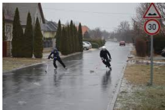
Jégpályává változott utak

Egyszer csak azon kaptuk magunkat, hogy máris magunk mögött hagyunk egy egész hónapot. Az elmúlt hétvégén megmutatta igazi erejét a tél, sőt annak is legveszélyesebb verziójával találkozhattunk vasárnap reggelre: az ónos eső korcsolyapályává változtatott mindent, ami az útjába került. Csak reménykedni tudunk, ettől senki nem dobott hátast és minden bonyodalom nélkül sikerült átvészelnünk ez a néhány kritikus órát. És ha ez így történt, minden ok megvan egy kis informálódásra. Lássuk tehát, mi zajlott házunk táján az elmúlt egy hónapban és mire számíthatunk a közeljövőben.